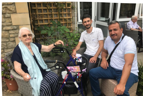
Wizyta w Domu Opieki Winash