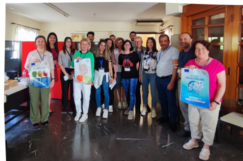
Spotkanie Międzynarodowe w Grecji