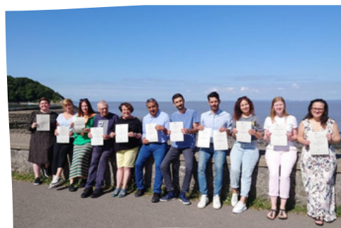
Szkolenie w Wielkiej Brytanii